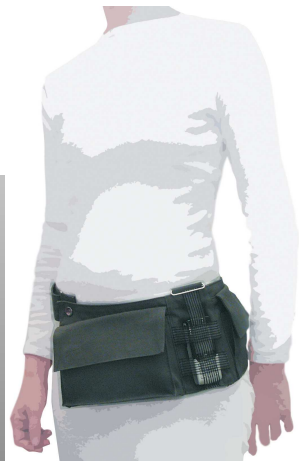
variobag: 4 in 1